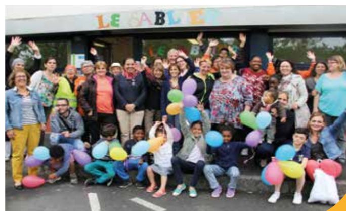
→ Ambiance aux Dervallières