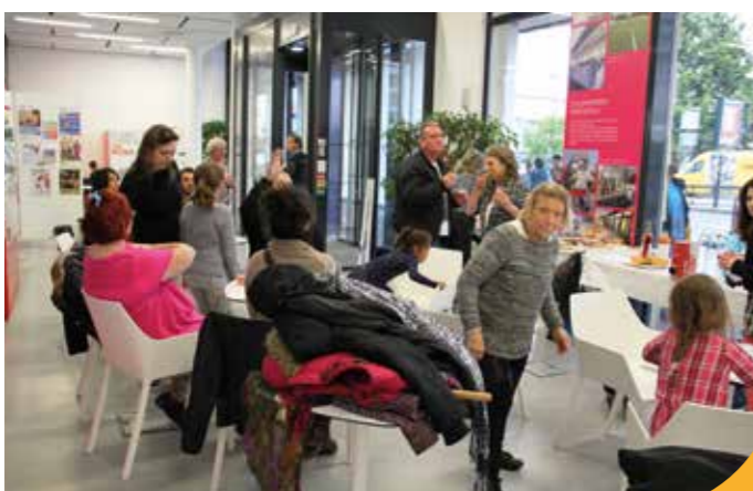
→ Dans la médiathèque à Bellevue.