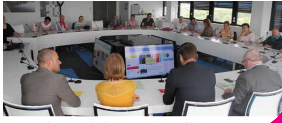
→ Signature du nouveau Plan de concertation locative début juin.

Pour répondre à l'ouverture de l'Office sur la métropole et à l'évolution de son organisation mais aussi aux nouveautés légales, Nantes Métropole Habitat a signé début juin un nouveau Plan de concertation locative avec les associations de locataires. Si les thèmes et la méthode de la concertation restent