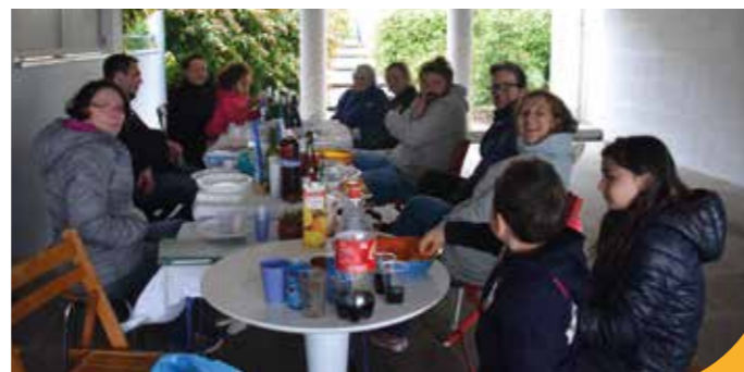
→ À l'abri à Broussais.