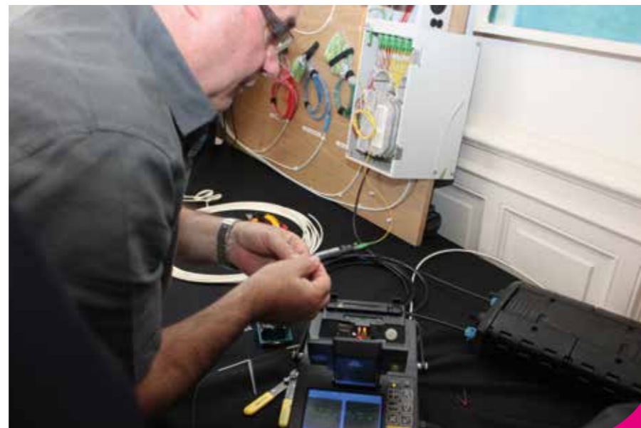
→ Installation de la fibre pour l'accès au haut débit.