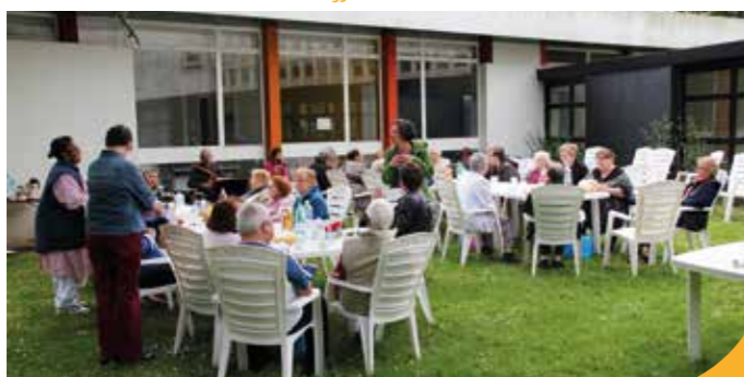
→ Avec la foyer logement au Breil.