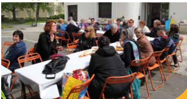
→ Sous le soleil au Clos Toreau