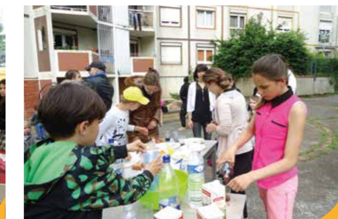
→ Gros goûter à la Petite Sensive.