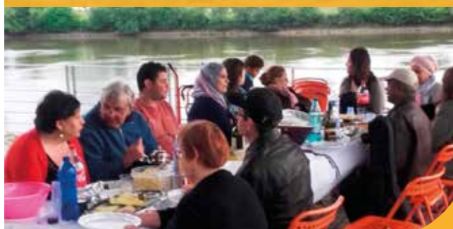
→ En bord de Loire à Malakoff.

→ Cette année, vous êtes près de 1000 personnes à vous être réunies autour d'un repas convivial dans le cadre du Printemps des voisins. Cette année encore, l'Office vous a accompagné pour l'organisation et la logistique de vos initiatives.