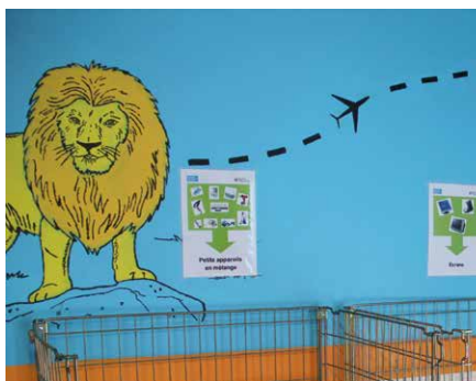
→ La fresque du local 3 rue du Luxembourg a été réalisée sur le thème du tour du monde.

Les jeunes ont présenté les propositions graphiques à Nantes Métropole Habitat, puis sont allés consulter les habitants de la tour en porte-à-porte pour finaliser leur choix artistique. Démarche menée avec entrain et succès, puisque les travaux de peinture ont démarré fin mars.