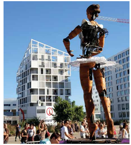
→ L'oiseau des îles : l'immeuble au toit pointu.

rels, le quartier de la création, les nefs, un parc urbain en bord de Loire, le futur CHU... illustrent les ambitions de ce nouveau territoire. D'ici 2020, 7000 nouveaux logements sont également prévus. Nantes Métropole Habitat contribue à ce développement avec une offre de logements sociaux au cœur de la ville : l'Oiseau des îles (livré en 2014) et l'Îlot des îles (32 appartements du T2 au T4 près de la grue jaune Titan / logements en location-accession et logements sociaux / Livraison 2018) actuellement en chantier, avant d'autres projets à venir.