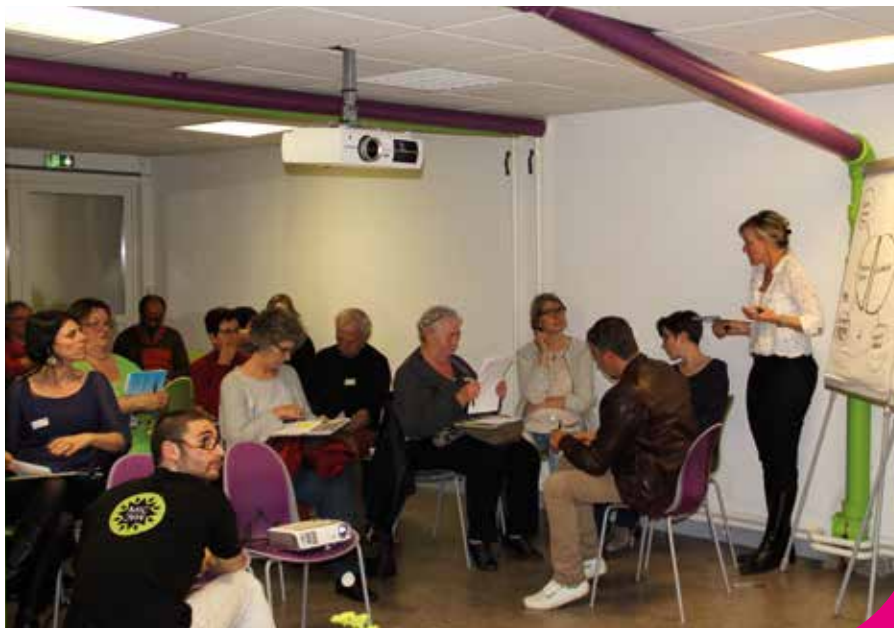
Un ciné-débat sur l'habitat participatif pour définir la démarche et apprendre à se connaître.