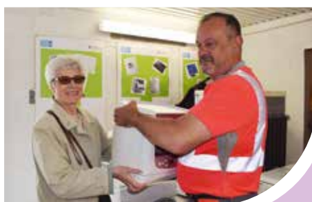
NMH et vous Page 7