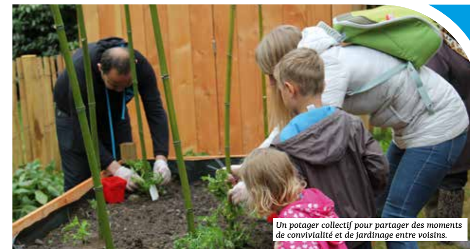
Un potager collectif pour partager des moments de convivialité et de jardinage entre voisins.

2018 de ce site pensé avec les habitants. « Ces travaux apportent une plus-value esthétique des espaces extérieurs et nous offrent un espace où nous pourrions nous retrouver avec plaisir ».