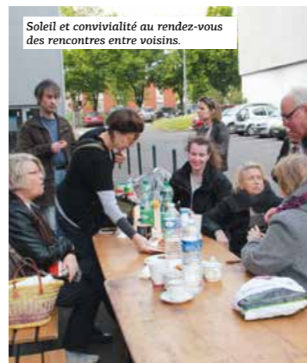
Soleil et convivialité au rendez-vous des rencontres entre voisins.

Comme chaque année, NMH s'est associé à la ville de Nantes pour soutenir les locataires dans leurs initiatives « Printemps des Voisins » afin de partager un moment convivial tout au long du mois de mai. Pour les locataires de l'office, le cru 2017 a enregistré pas moins de 20 rencontres au cœur des quartiers nantais : apéritifs, goûters, repas, barbecues... ont réuni de 30 jusqu'à 100 convives chacune.