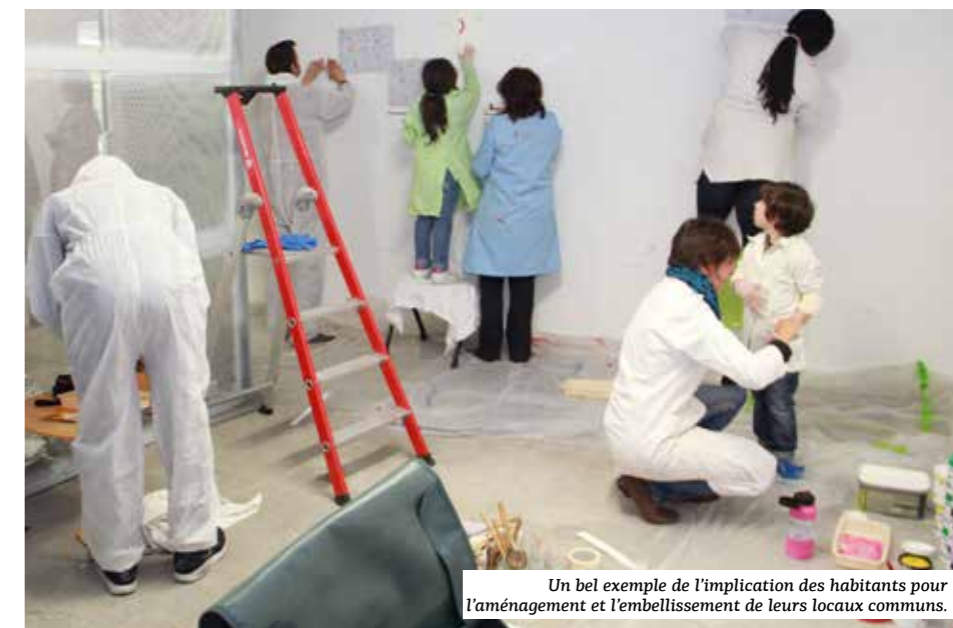
Un bel exemple de l'implication des habitants pour l'aménagement et l'embellissement de leurs locaux communs.

ont enfilé leurs blouses pour décorer les murs avec pochoirs et peintures. Des range-vélos muraux et au sol ainsi que des range-trottinettes complètent l'installation. À l'occasion de ce chantier, NMH était partenaire de « Plan Job ». Ce dispositif, mis en place par l'association Léo Lagrange, permet à des jeunes de 16 à 21 ans d'avoir un petit contrat de travail sur des actions événementielles de ce type.