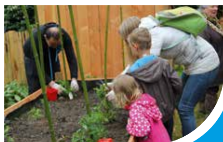
Les quartiers en bref Page 3