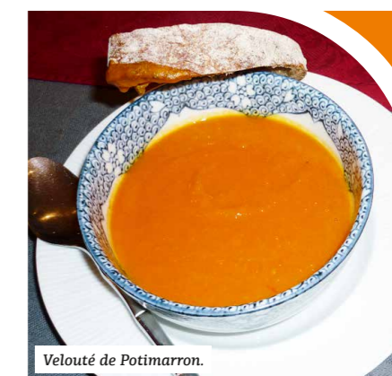
Velouté de Potimarron.