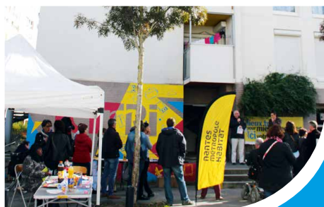
Les quartiers en bref Page 3