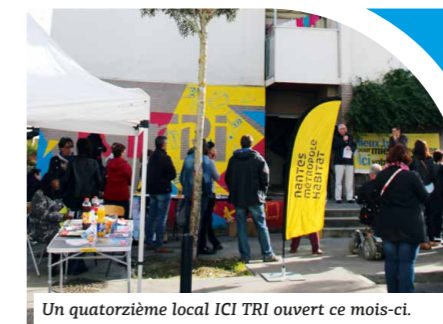
Un quatorzième local ICI TRI ouvert ce mois-ci.