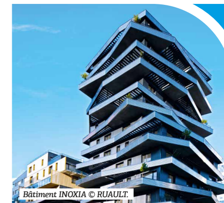
Bâtiment INOXIA

« Ne plus construire, c'est condamner les locataires à rester dans leur logement actuel et ne pas bénéficier d'appartements neufs, comme j'ai pu le faire en déménageant dans l'immeuble INOXIA. »