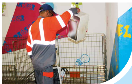
NMH et vous Page 7