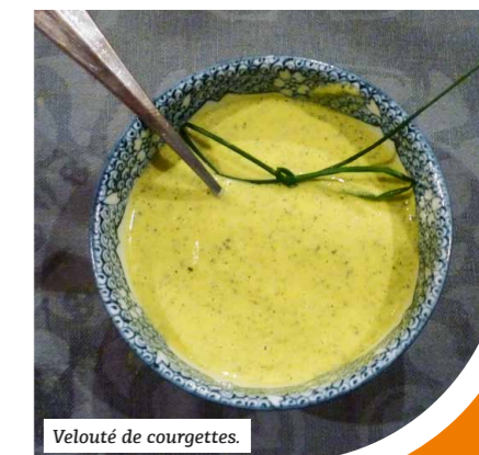
Velouté de courgettes.