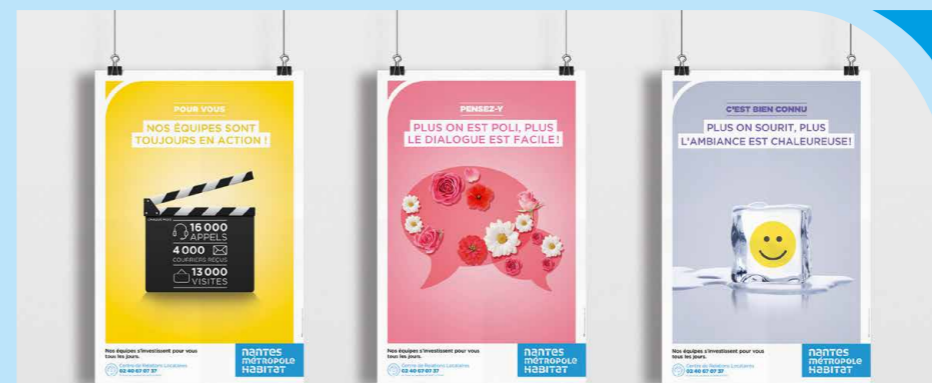
Les trois visuels seront affichés successivement jusqu'en février 2018.

Les trois messages répondent aux incivilités ou comportements les plus fréquemment observés et sont déclinés en trois affiches différentes. Un travail a été mené avec un groupe de collaborateurs d'agences pour déterminer les messages.