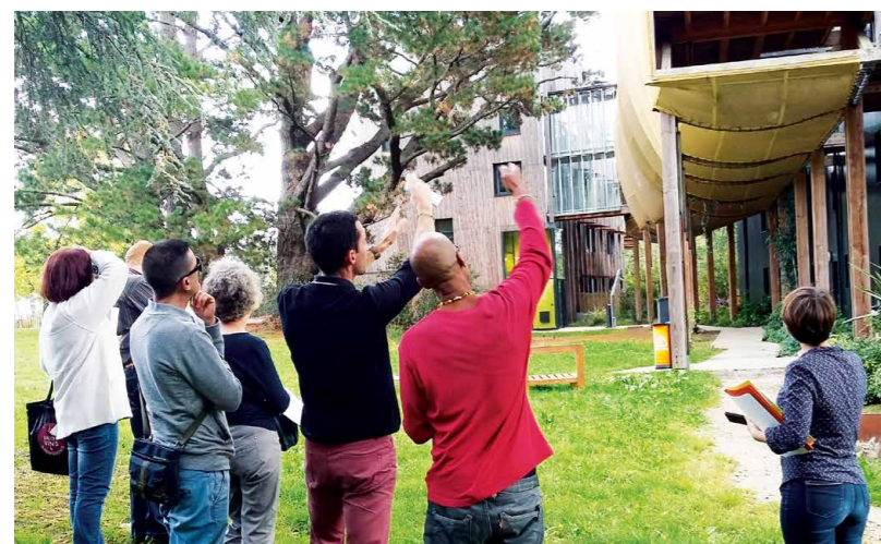
À la découverte du savoir-faire de l'Office en termes de construction.

Prochaine grande étape : la participation au processus de sélection du Groupement (entreprises et architecte). Deux représentants du collectif auront une voix délibérative au jury de désignation prévu en novembre prochain.