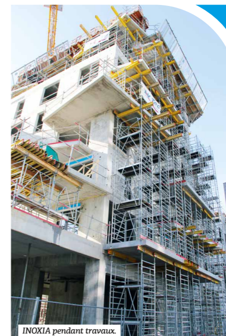
INOXIA pendant travaux.