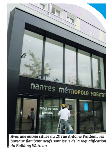
Avec une entrée située au 20 rue Antoine Watteau, les bureaux flambant neufs sont issus de la requalification du Building Watteau.

La rénovation de l'immeuble Watteau est terminée : les 209 logements, les parties communes et l'enveloppe du bâtiment ont entièrement été remis à neuf. Les travaux ont également concerné la nouvelle agence de proximité. Avec une entrée au 20 rue Antoine Watteau, le personnel vous y accueille dans des conditions optimales à partir du 23 octobre.