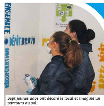
Sept jeunes ados ont décoré le local et imaginé un parcours au sol.

Pour rappel, ce local est ouvert le lundi de 10h à 12h et le vendredi de 14h à 16h.