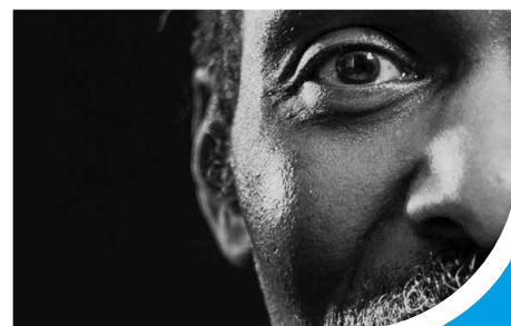
À vos agendas Page 12