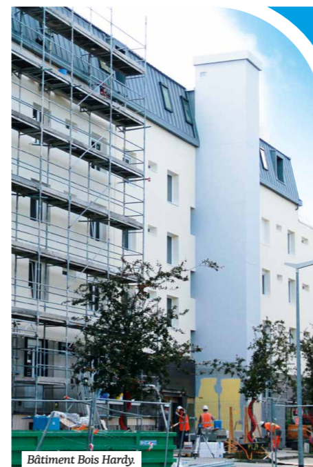
Bâtiment Bois Hardy.

sociaux seront fragilisés financièrement et auront du mal à maintenir leurs investissements dans la construction, la rénovation et les actions de proximité, au service des habitants comme, par exemple, les locaux ICI TRI, la médiation sociale, etc.