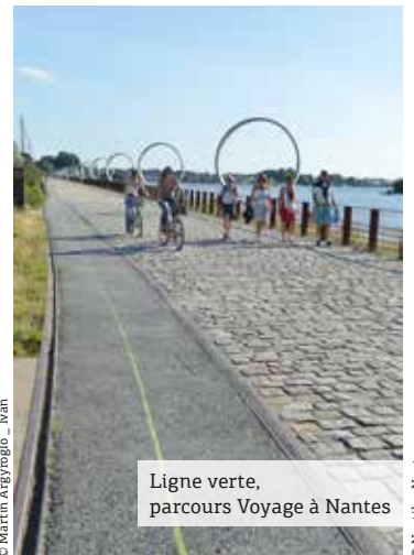
Ligne verte, parcours Voyage à Nantes