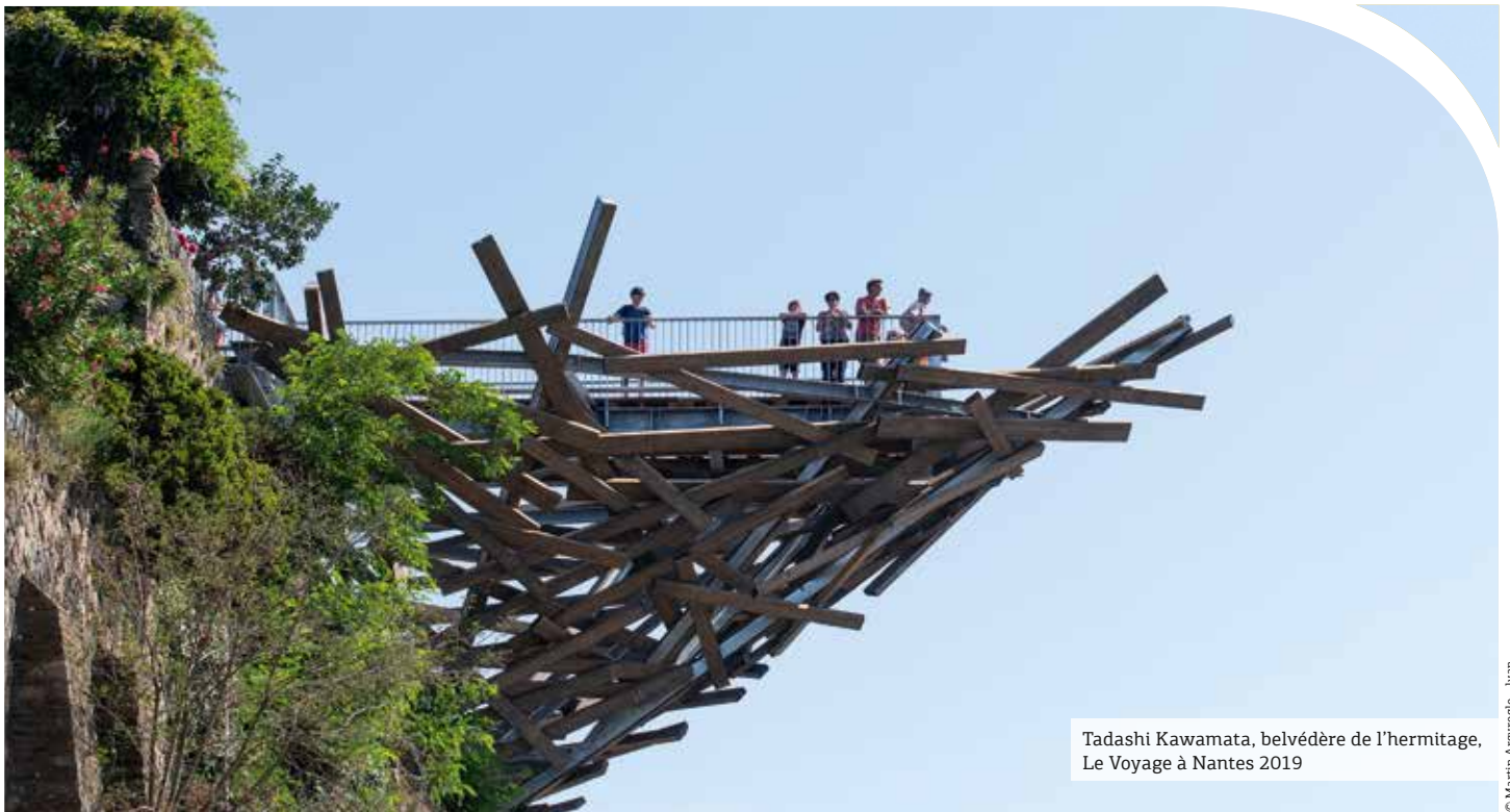
Tadashi Kawamata, belvédère de l'hermitage, Le Voyage à Nantes 2019