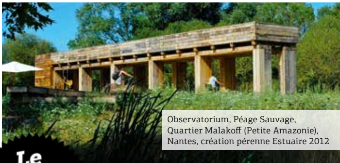
Observatorium, Péage Sauvage, Quartier Malakoff (Petite Amazonie), Nantes, création pérenne Estuaire 2012