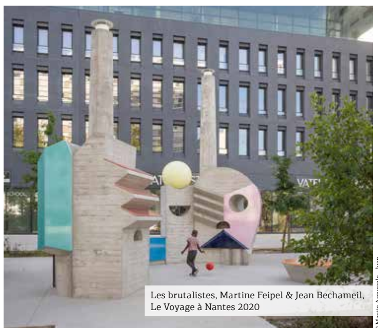
Les brutalistes, Martine Feipel & Jean Bechameil, Le Voyage à Nantes 2020

Pour en savoir plus : www.levoyageanantes.fr