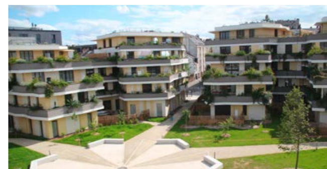
La livraison de l'ensemble des logements s'achèvera en septembre 2021.

Avec près de 50 % de logements sociaux, le programme immobilier « Révélation » accueille des locataires aux profils variés. Une attention toute particulière est portée au « bien-vivre ensemble » et à partir de cet été, une terrasse accueillera un jardin partagé, animé par l'association Bio-T-Full.