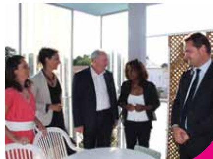
Rencontre avec les habitants de la Résidence de la Civelière

Il vient compléter l'offre d'accueil des personnes âgées sur le territoire nantais. Pour rappel, trois quarts des personnes âgées de 85 ans et plus vivent à leur domicile, l'autre quart étant résidant en structure d'hébergement. En complément de l'EHPAD, Nantes Habitat a construit sur le même site une résidence de 36 logements sociaux, la Résidence de la Civelière. Ces logements contribuent au renouvellement de l'offre sur ce quartier des bords de Sèvre en plein développement.