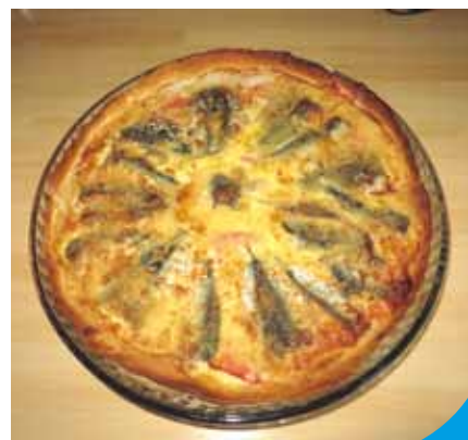
Une recette originale pour des sardines...

Saupoudrez de chapelure et d'un filet d'huile d'olive. Enfournez 30 minutes.