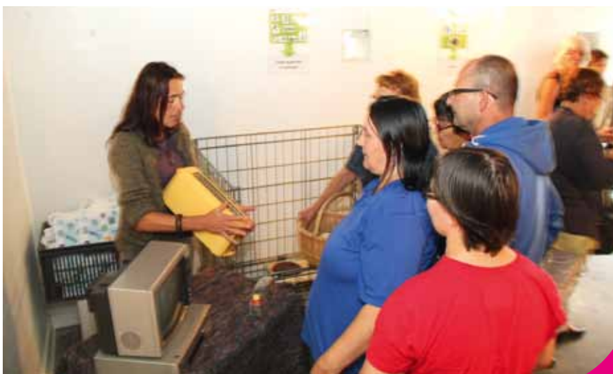
Des ateliers pédagogiques sont proposés pour apprendre à trier ou à redonner vie aux objets du quotidien.