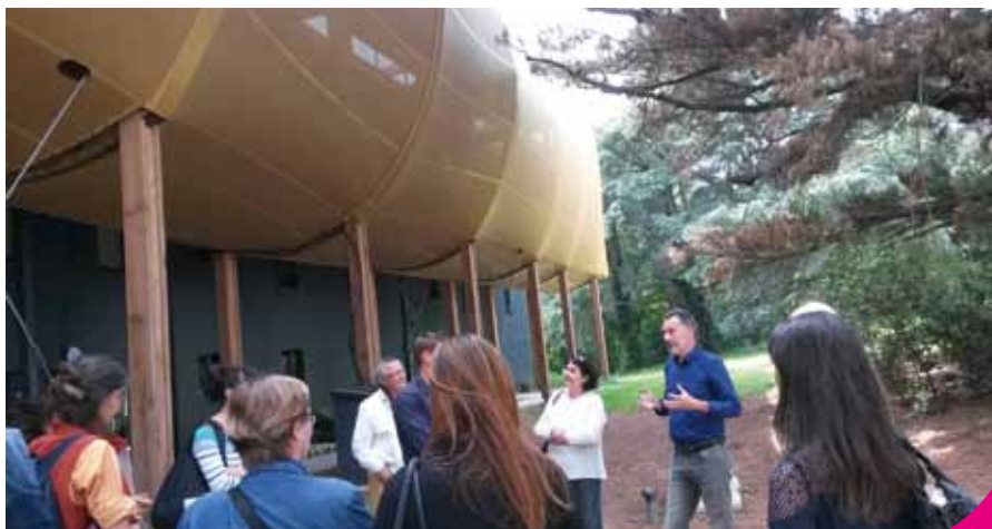
Visite commentée par l'architecte pour comprendre les principes d'un bâtiment à énergie positive.

« C'est vraiment un beau bâtiment ! » ont conclu les visiteurs.