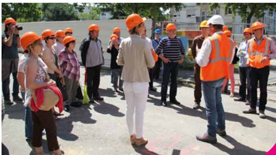
Plongée au cœur d'un chantier hors normes de rénovation.

La troisième édition de la Semaine nationale des HLM, « HLM, fabriques de vies actives », visait à faire connaître les métiers du secteur qui répondent aux grands enjeux de transformation de notre société. Nantes Habitat s'est associé à l'événement. À l'occasion de la livraison des 65 logements de la première tranche des travaux de rénovation du Building, l'Office y a organisé des visites métiers. Une quarantaine de personnes, dont des locataires, a pu découvrir « grandeur nature » l'opération spectaculaire de rénovation du Building. Les différentes phases et les métiers ont été présentés tout au long de la visite du chantier et d'un étage entièrement rénové : concertation, architecture, conduite de travaux, suivi de chantier, livraison. Les présentations et explications ont permis à l'ensemble des visiteurs de mieux comprendre les enjeux et la complexité d'un chantier de rénovation de logements.